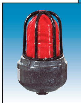
XB15 Монтажа на цев Напомена: Само (са ливеном заштитом)