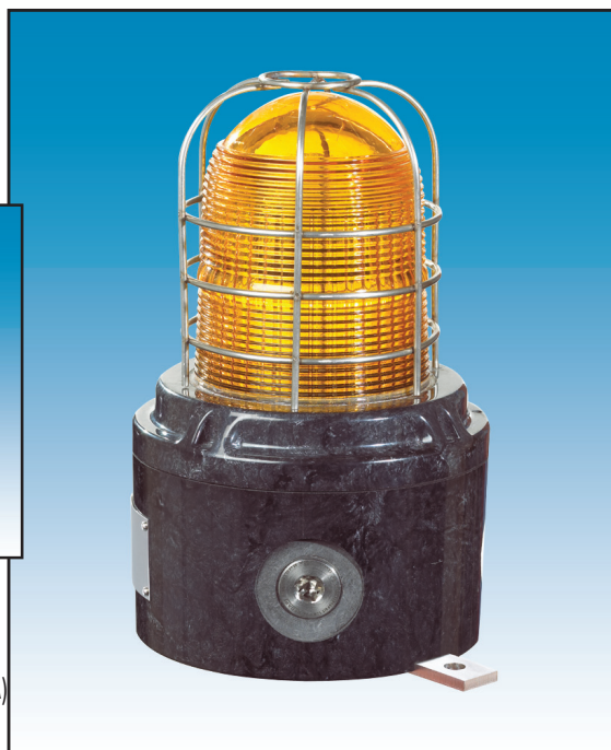
XB15 Директна монтажа (са заштитном жицом)